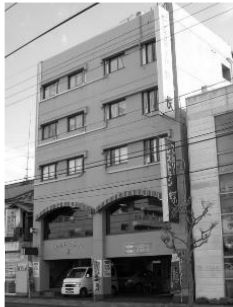
ビジネスホテル弁長→