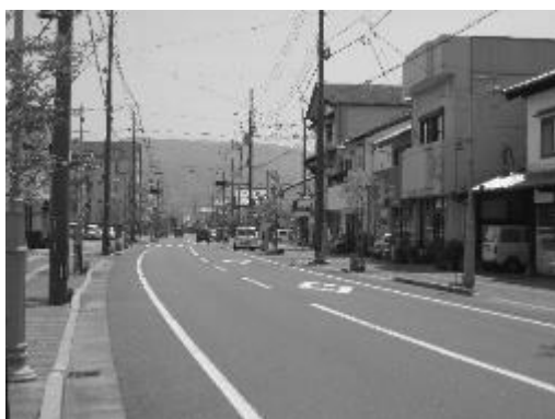
安芸本町商店街 街路