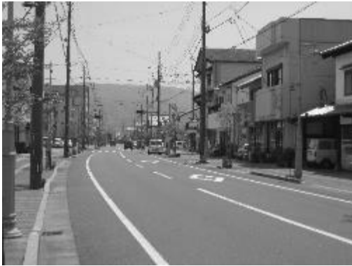
安芸本町商店街 街路